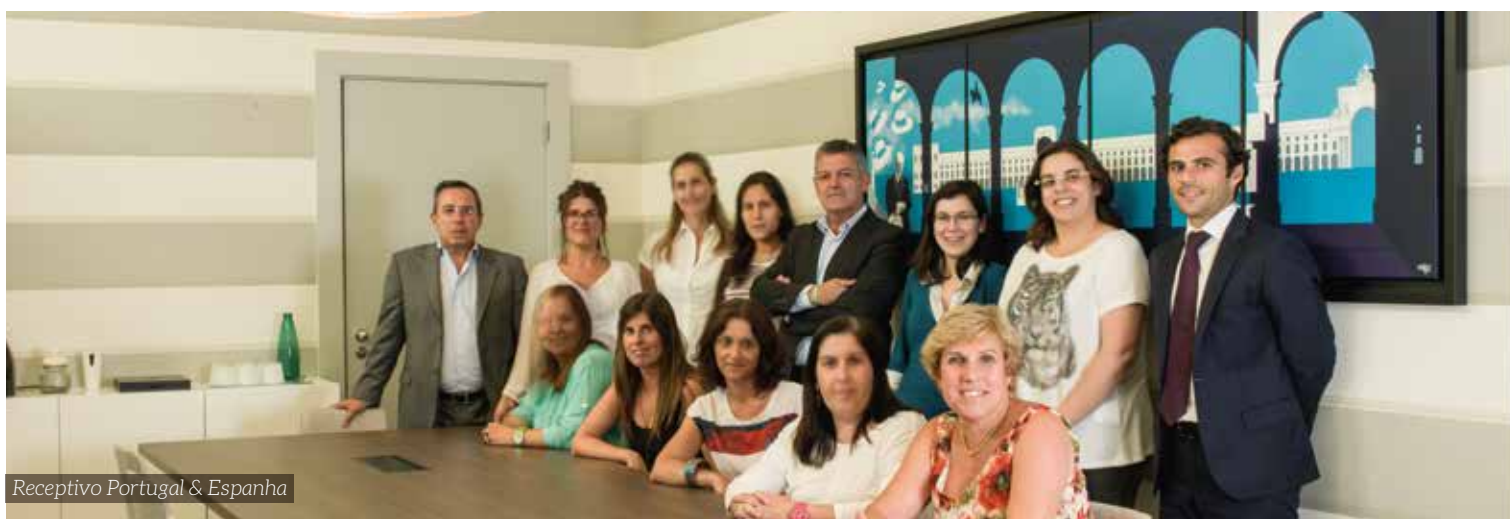
Receptivo Portugal & Espanha

A missão da OSIRIS é facultar um serviço personalizado e de exímia qualidade, procurando uma relação permanente de grande proximidade com os seus clientes. O grupo ambiciona continuar a ser uma das referências nacionais na gestão de “viagens e eventos” corporativos e em viagens de lazer. Como especialista no receptivo de turistas em Portugal e Espanha, o grupo pretende ser uma referência internacional.